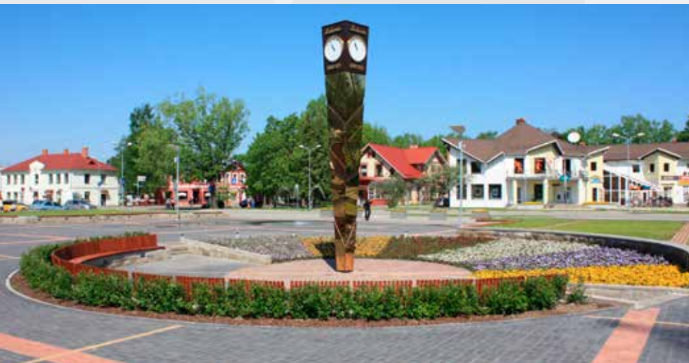
Площадь возле станции Сигулда