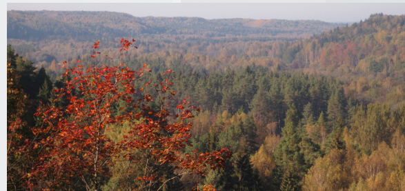
Skats no Paradīzes (Gleznotāju) kalna