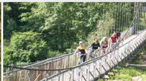
Пересечение реки Гауя