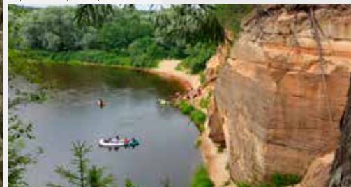
Орлиные (Органные) скалы