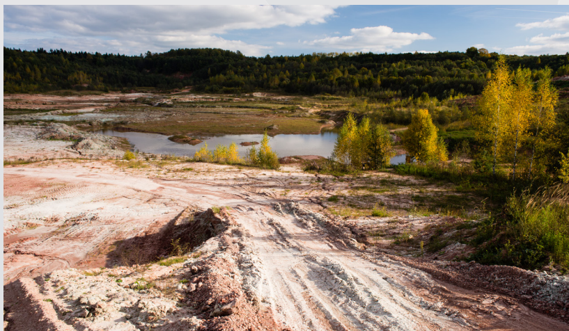
Lodes mālu karjers

Pievērs uzmanību! No avotiem iztekošajos strautos, pie alu ieejām un smilšakmens atsegumiem redzamas brūnas gļotas – dzelzs baktērijas. Klinšu piekājē – satrupējušās liela mēroga kritālas un sausokņi, kuros dzīvo dažādas vaboļu sugas, vārpstīņgliemeži. Redzami dzeņu un dziļnu kalumi. Uz atsegumiem – vientuļo bišu kolonijas, dažādas sūnu (mēlītes vijzobe, parastā konusgalvīte u.c.) un ķerpiju (krevu ķerpi, melnā cistokoleja, peltīģeras u.c.) sugas, saldsaknītes, trauslās pūslīšpārpades, paceplīša ligzdošanas vieta. Apkaimē – piemērota sēņu vērošanas vieta.