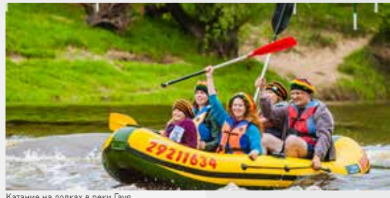
Катание на лодках в реки Гауя