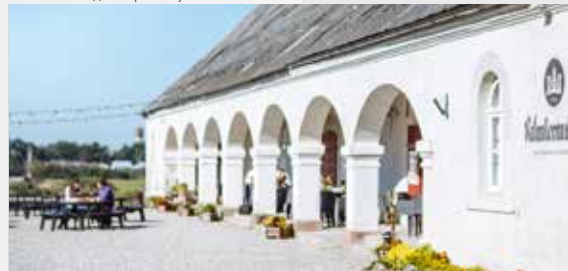
Пивоварня Valmiermuižas alus