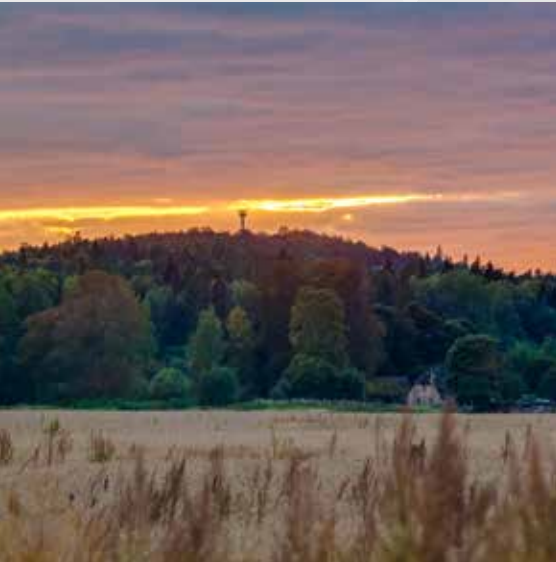
Синяя гора (Зилайскалнс)