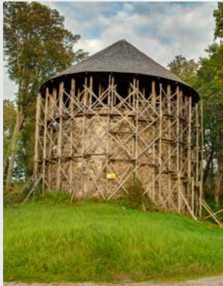
Белая башня Муянского средневекового замка