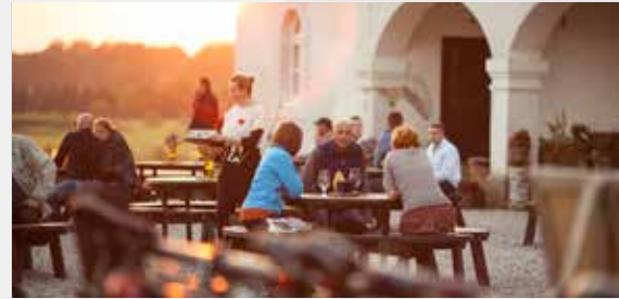
Пивоварня Valmiermuižas alus