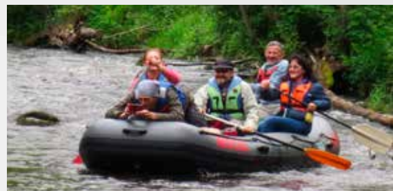
Гребля на реке Браслы