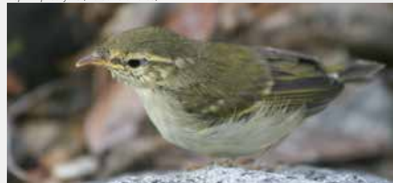
Зеленоватый камышевки ( Phylloscopus trochiloides )