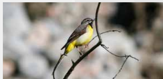
Серый трясогузка ( Motacilla cinerea )