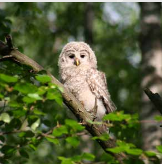
Неясьть ( Strix uralensis )