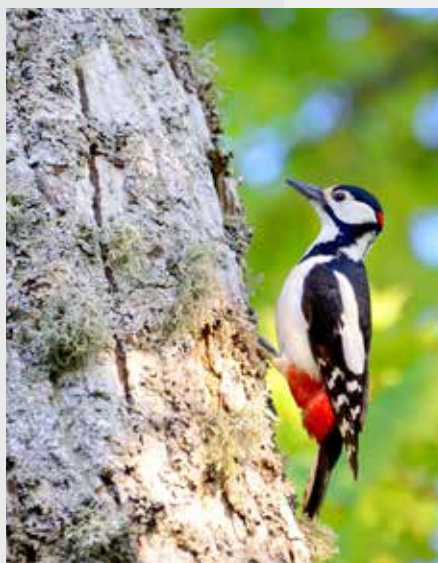
Великий пестрый дятел ( Dendrocopos major )