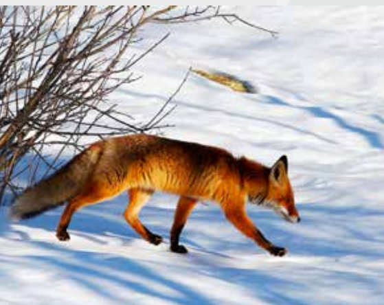
Лиса ( Vulpes vulpes )