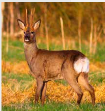
Косуля ( Capreolus capreolus )