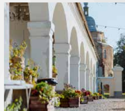
Пивоварня Valmiermuižas alus и Пивная кухня