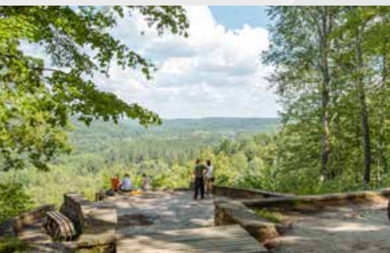
Райский холм (холм Живописцев)

RĀMKALŅI – СИГУЛДА – ЛИГАТНЕ – ЦЕСИС – ВАЛМИЕРА