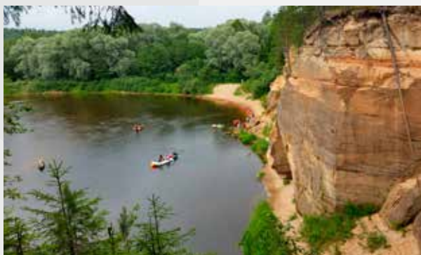
Орлиные (Органье) скалы