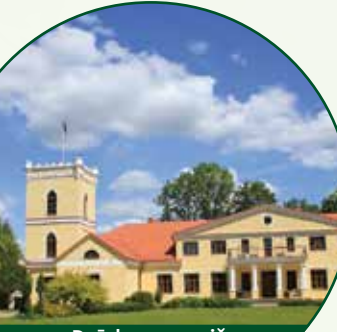
Dzērbenes muiža Dzerbene manoir

"Lampu dizaina darbnīca" / Lamp design workshop, +371 29424560