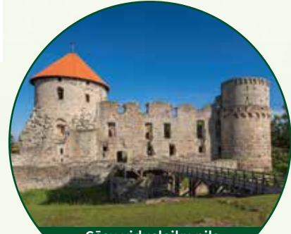
Cēsu viduslaiku pils Cesis Medieval Castle

Āraišu arheoloģiskais parks / Āraiši Archeological Park, +371 25669935