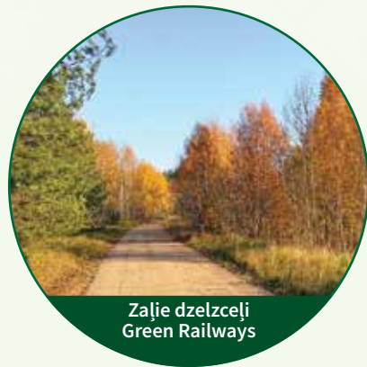
Zaļie dzelzceļi Green Railways