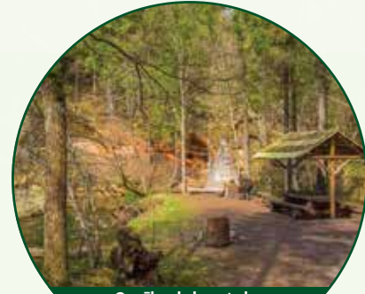
Ceciļu dabas taka Ceciļi Nature Trail

Ceciļu dabas taka / Ceciļi Nature Trail +371 29477700