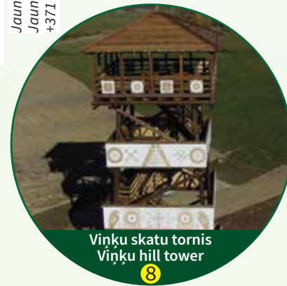
Viņķu skatu tornis Viņķu hill tower

8) Gulbenes novada vēstures un mākslas muzejs / Gulbene Municipality History and Art Museum, +371 64473098