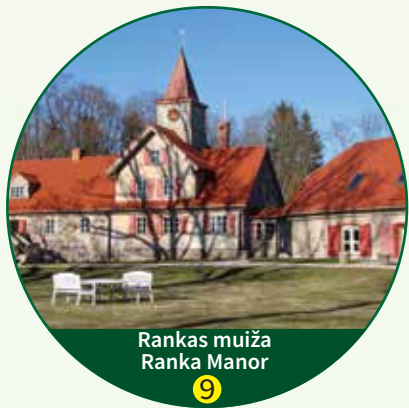
Rankas muiža Ranka Manor