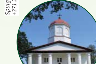
Drustu baznīca Drusti church

Spulgu ciemā / Relaxation in "Spulgas", +371 26114226