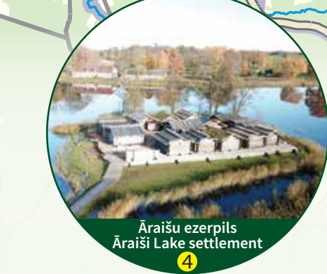
Āraišu ezerpils Āraiši Lake settlement

Piedzīvojumus ar haskijiem ziemā un vasarā/ Adventure with huskies in winter and summer +371 25951531