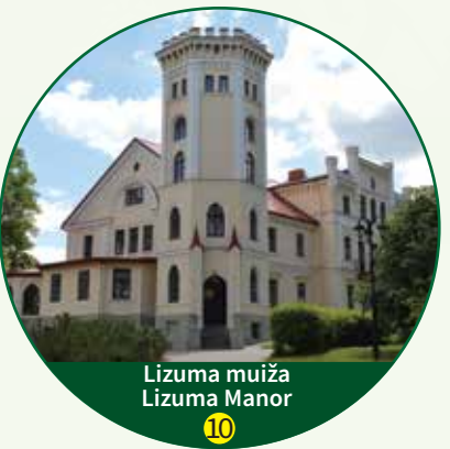
Lizuma muiža Lizums Manor