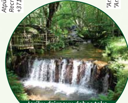
Ieriķu dzirnavu dabas taka Nature trail of Ieriķi Mill

Ieriķu dzirnavu dabas taka / Nature trail of Ieriķi Mill, +371 28396804