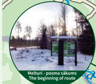
Melturi - posma sākums The beginning of route